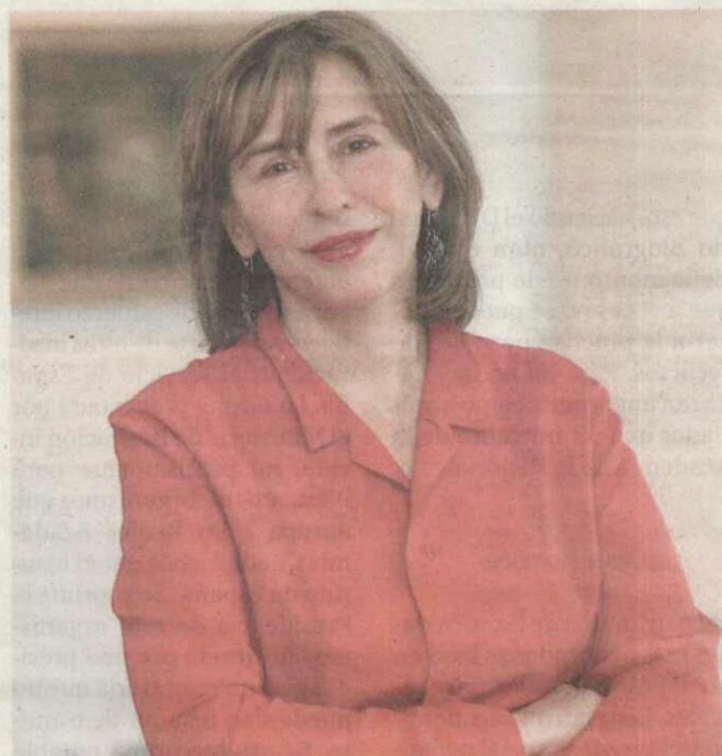
Azar Nafisi, ayer, en Barcelona

Asegura la escritora que la necesidad de escribir «Cosas que he callado» se le apareció cuando su padre y su madre murieron y le embargó la sensación de que habían dejado más de una conversación pendiente. De ahí que la autora iraní empezase a hurgar en sus recuerdos y en los de sus padres —alcalde de Teherán él y una de las primeras muje-