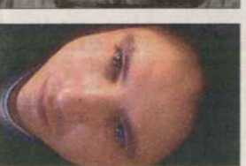
ALEJANDRO ZAMBRA CHILE, 1975

De origen japonés, vive en Providence, Estados Unidos.