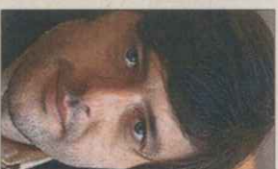
ANDRÉS BARBA ESPAÑA, 1975

PALAU DE LA MÚSICA CATALANA (19.00) El destacado pianista ofrece junto a la Orquesta Sinfónica del Vallès un singular programa dedicado a Beethoven.