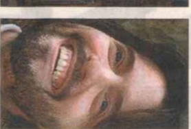
ANDRÉS NEUMAN ARGENTINA, 1977

Debuta en la novela con 'Siete maneras de matar un gato'.