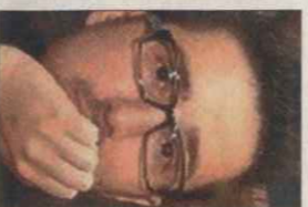
PATRICIO PRON ARGENTINA, 1975

Único representante de las letras mexicanas.