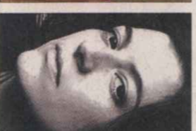
SAMANTA SCHWEBLIN ARGENTINA, 1978

El premio Alliquara le dio popularidad, vive en Barcelona.