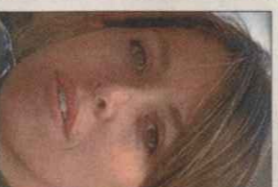
LUCÍA PUENZO ARGENTINA, 1976

El más alemán de los escritores argentinos vive en Madrid.