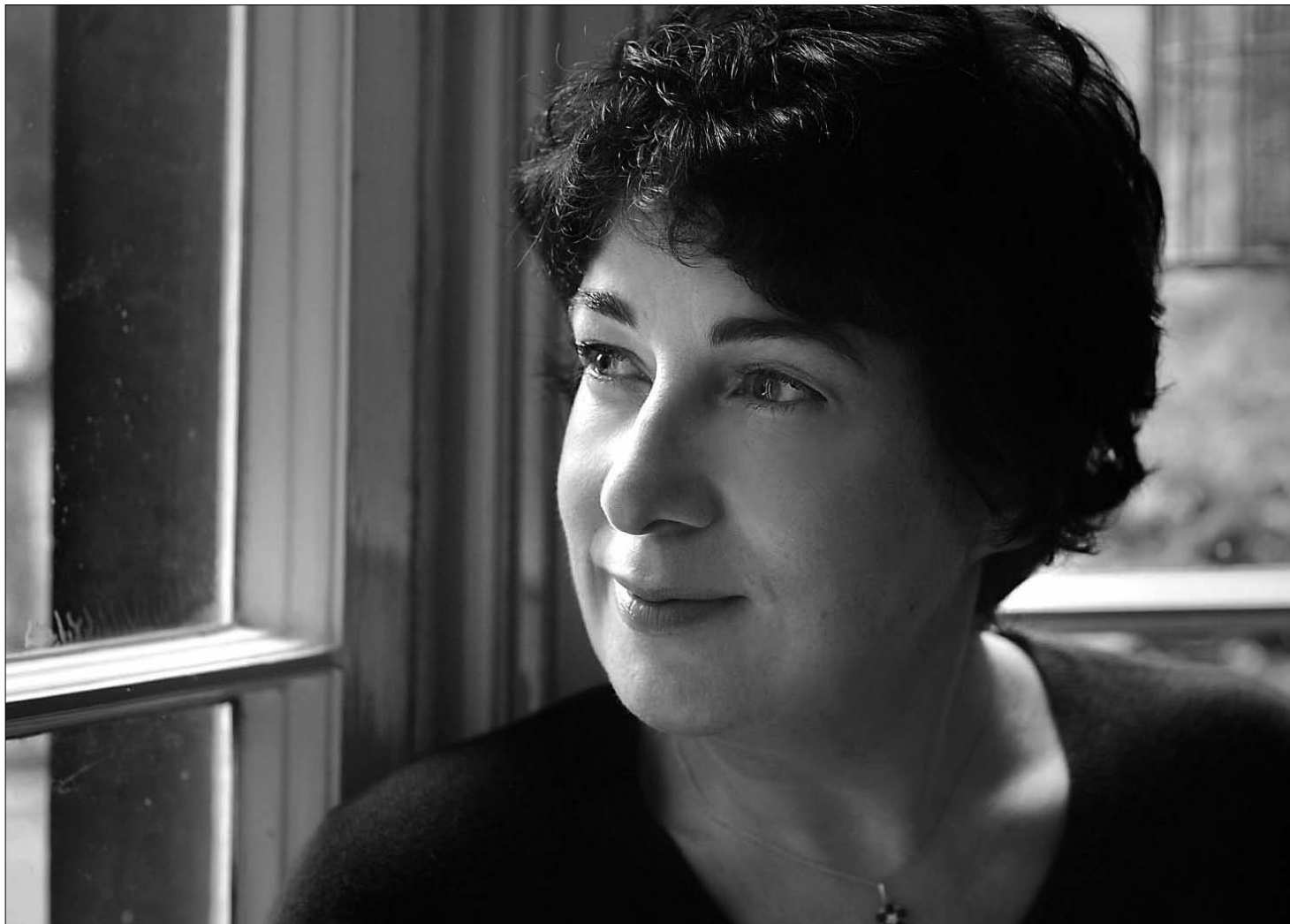
Joanne Harris vuelve a deleitarnos con una novela ambientada en el pequeño pueblo de Lansquenet y con Vianne como protagonista.

Una celebración del placer, del amor y de la tolerancia en toda regla que encuentra su continuidad, catorce años después, en la no menos exquisita El perfume secreto del Melocotón ,