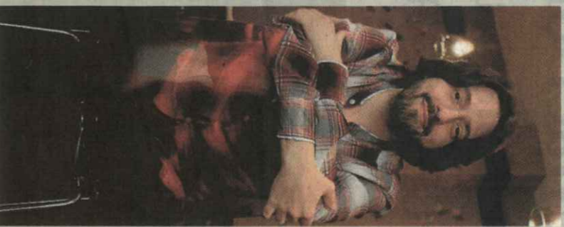
> ANDRÉS NEUMAN > AUTOR DE 'EL VIAJERO DEL SIGLO'