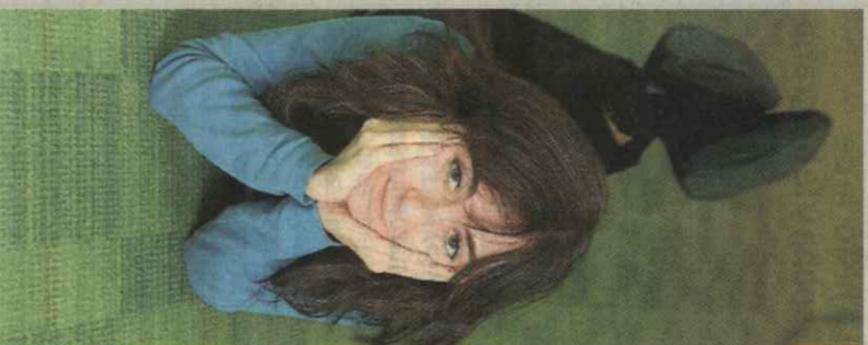
> ELVIRA NAVARRO > AUTORA DE 'LA CIUDAD FELIZ'