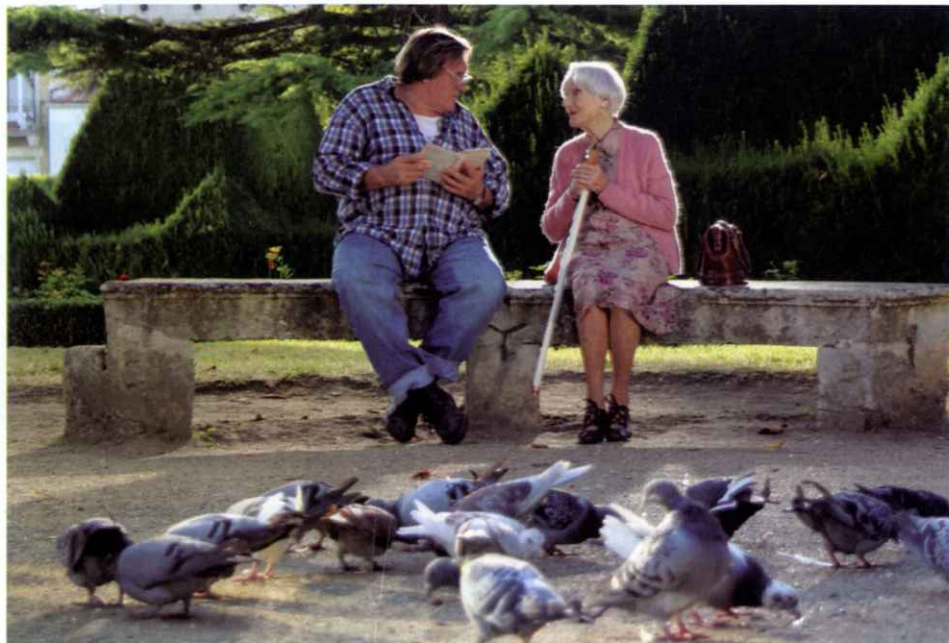
Gérard Depardieu y Gisèle Casadesus, una pareja amiga de los libros y los parques.